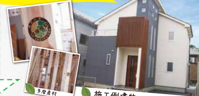
多摩産材 施工例建物