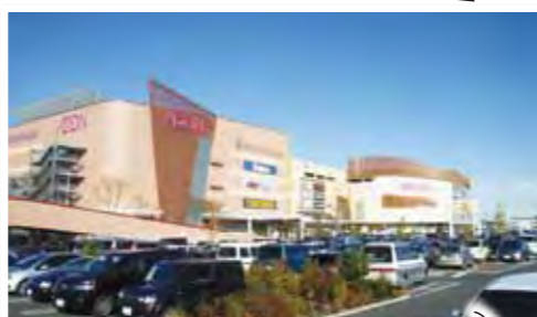
イオンモールも近くにあり生活便利！(約1000m)

土地価格/1,580～1,880万円交/武蔵引田駅徒歩7分土/134.57～148.25㎡地目/宅地(現況造成中※完了予定/平成24年11月中旬)※開発許可/24多建開一開第51号用/一低建/40%容/80%設/個別プロパン・公営水道・本下水・東電幅/西側約5m私道所/あきる野市引田(全4区画販売)※他私道持分各区分画有※建築条件付